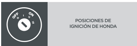
Diagrama: 0 - Apagado, I - Encendido, II - Arranca el motor